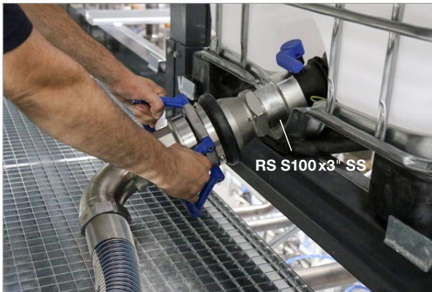
Reduzierstück RS S100x3" SS mit DDC-V 80-3" SS Kupplung Female reducer RS S100x3" SS with DDC-V 80-3" SS coupling