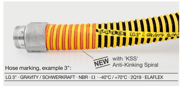
Hose marking, example 3":

LG 3" · GRAVITY / SCHWERKRAFT · NBR · Ω · -40°C / +70°C · 2Q19 · ELAFLEX