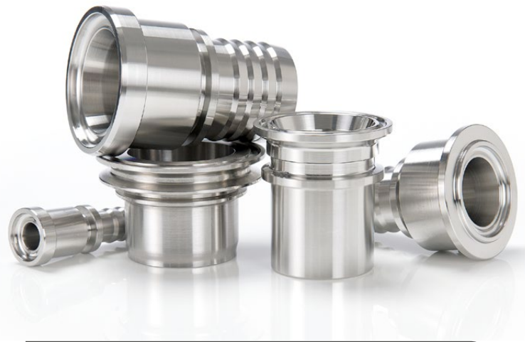
Verpressung 'totraumfrei / umbördelt'

Verpresste Schlaucharmatur mit bündiger Verbindung zum Schlauchstutzen, für hohe Ansprüche an die Medienreinheit. Alle marktgängigen Armaturen können verwendet werden.