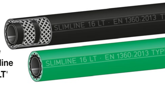
Type Slimline 'SL LT' Slimline Low Temperature