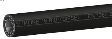
Type Slimline 'SL BIO' Slimline Biodiesel

SLIMLINE quality petrol pump hoses for gasoline and diesel fuels. Also suitable for fuels with ethanol content up to E 85 and Biodiesel up to B30 (BIO Type up to B 100). Meets weights and measures regulations, see overleaf. Cold flexible down to -30°C / -22°F (LT-type down to -40°C / -40°F).