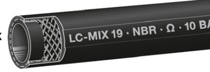
Type LC-Mix Lining NBR electr. dissipative

Economy priced light weight pump hose with textile reinforcement for gasoline, diesel, fuel oil, petroleum. Can not be calibrated.