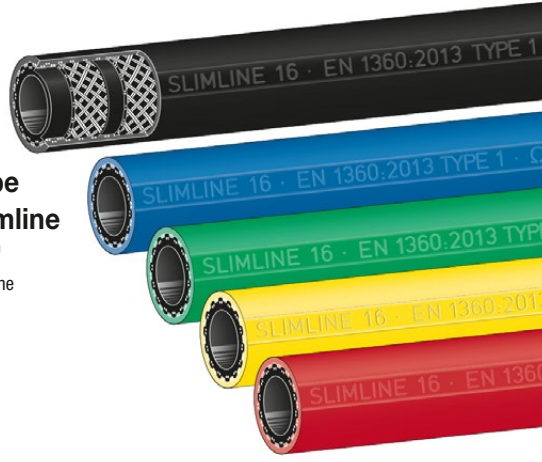
Type Slimline 'SL' Slimline

Innen : NBR schwarz, nahtlos extrudiert, elektrisch ableitfähig, nicht ausfärbend Festigkeitsträger : zwei dehnungsarme Textilgeflechte mit gekreuzten, eingeflochtenen Spezial-Leitfäden Außen : glatt, öl-, UV- und ozonbeständig, hoch abriebfest. Werkstoff siehe Tabelle.